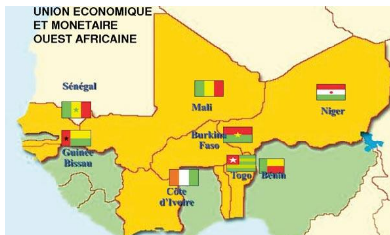
Carte 1 : Carte de situation